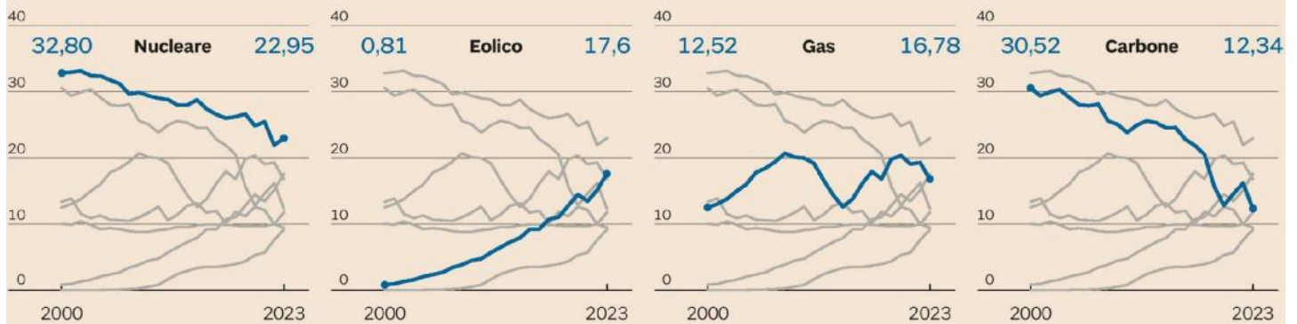
Quota di generazione elettrica nella Ue per fonte in %