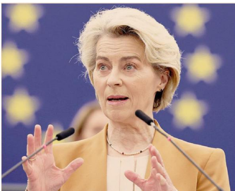
Le raccomandazioni della Commissione Ue. La presidente Ursula von der Leyen

Tornando al target relativo al 2040, i commenti ieri sono stati contrastanti. «Questo obiettivo cadrà nel vuoto se non sarà accompagnato da un'eliminazione graduale dei combustibili fossili», avvertiva Sofie Defour, direttrice della Ong Transport & Environment. Mentre l'associazione dei consumatori europei BEUC criticava la decisione di stralciare qualsiasi suggerimento relativo al mondo agricolo, tenuto conto che questo contribuisce «in larga misura all'impatto climatico in Europa».