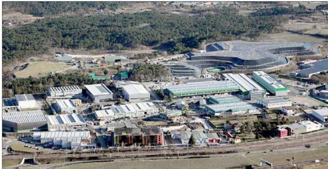
La discarica dei Lavini a Lizzana. È uno dei tre siti che potrebbe ospitare il termovalorizzatore provinciale

La Provincia assicura che se ne riparerà la prossima legislatura - in inverno, per capirci - ma la necessità di chiudere il ciclo dei rifiuti è impellente come quella di dotarsi di un impianto per smaltire i residui urbani. Discariche, infatti, non ce ne sono più e, tra l'altro, gli studi certificano che inquinano meno un termovalorizzatore rispetto, appunto, a seppellire l'immondizia. Per questo il consiglio comunale è chiamato mercoledì sera a votare la proposta del quinto emendamento del piano provinciale di smaltimento dei rifiuti, passaggio necessario per arrivare al dunque. Il civico consesso dovrebbe condividere la necessità di trovare una soluzione per la chiusura del ciclo dei rifiuti in Trentino pur senza abbandonare le politiche di riciclo e raccolta differenziata che, proprio nella città della Quercia, evidenziano dei parametri di successo particolarmente significativi, mirando in ogni caso ad una omogeneizzazione dei territori, facendo in modo che i comuni meno virtuosi seguano l'esempio di quelli più performanti. Se, come pare, arriverà l'ok ad un impianto finale per lo