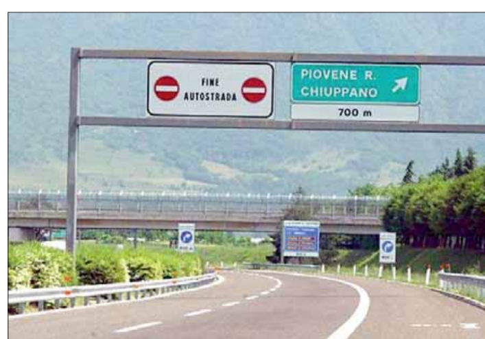
L'ultimo tratto dell'A31 oggi, fine autostrada a Piovene Rocchette

Quando il prolungamento a nord dell'A31 Valdastico prevedeva di agganciarsi all'Autostrada del Brennero all'altezza di Trento, i Comuni del vicentino interessati dal passaggio dell'opera erano favorevoli, così come la Regione Veneto. Lo ritenevano un effettivo accorciamento della distanza e dei tempi per chi punta verso il Brennero e un alleggerimento della sovraccarica Valsugana. Poi è venuta l'ipotesi di sbocco a Besenello, ma il Comune ha vinto la battaglia in Consiglio di Stato e in Cassazione contro il progetto, peraltro all'epoca ancora incompleto. Ora invece il tracciato su cui punta la giunta Fugatti, con sbocco a Rovereto sud, non convince più nessuno sul versante veneto. Il completamento della Valdastico nord partirebbe dall'attuale ultimo casello di Piovene Rocchette. Il primo lotto è tutto in territorio vicentino: circa 18 chilometri fino a Valle dell'Astico-Pedemonte. Costo 1,3 miliardi di euro, tutto a carico dell'A4 Holding (Abertis cioè Atlantia-Benetton), concessionaria della Brescia-Padova. Il secondo lotto, quasi 30 chilometri in gran parte in territorio trentino e in gran parte in galleria, arriverebbe al casello A22 di Rovereto sud. Costo lievitato da meno di 1 miliardo a 2 miliardi, se