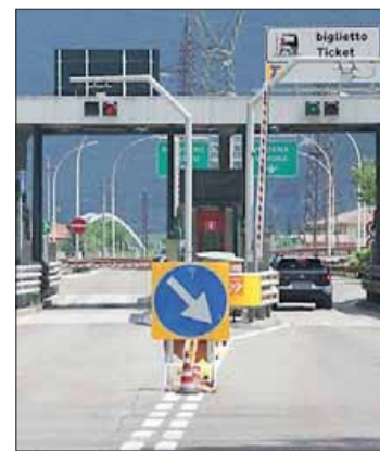
L'attuale ingresso dell'A22

ALA - AVIO - I lavori partiranno nel prossimo maggio e finiranno in poco più di due anni. Al termine, si avrà non solo una nuova stazione autostradale di Ala-Avio, ma anche un nuovo centro per la sicurezza autostradale e un nuovo raccordo con la viabilità provinciale. La gara d'appalto, disposta da Autostrada del Brennero a seguito del via libera da parte del ministero al progetto esecutivo, ha prodotto un ribasso del 21,2% sulla base di gara portando a 19,7 milioni il costo complessivo dell'opera. Un ribasso che si accompagna ad un miglioramento del sistema di ispezione e monitoraggio della rotonda ellittica che sarà sospesa sul canale Biffis, interamente digitalizzato, e ad una riduzione dei giorni di senso unico alternato sulla strada provinciale 90 durante i lavori, passati da 130 a 90.