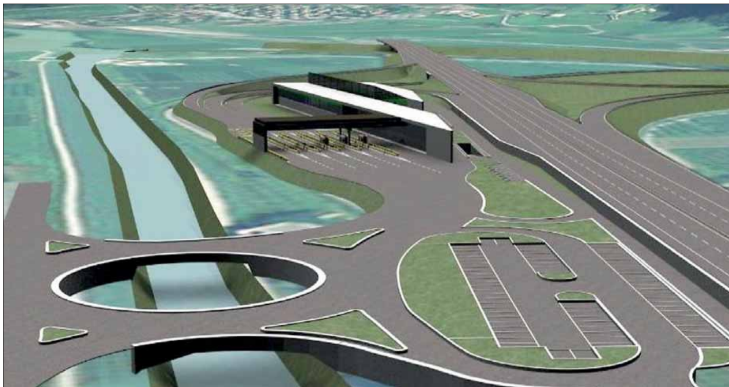
Il rendering del progetto del nuovo casello dell'A22: un nuovo parcheggio, il nuovo centro per la sicurezza autostradale e la rotonda ellittica sospesa sul Biffis

Diversi i vincoli imposti dal contesto: l'impossibilità di allargare la strada provinciale per dotarla di corsie di accumulo e accelerazione, la ravvicinata presenza del canale Biffis e gli accessi pri-