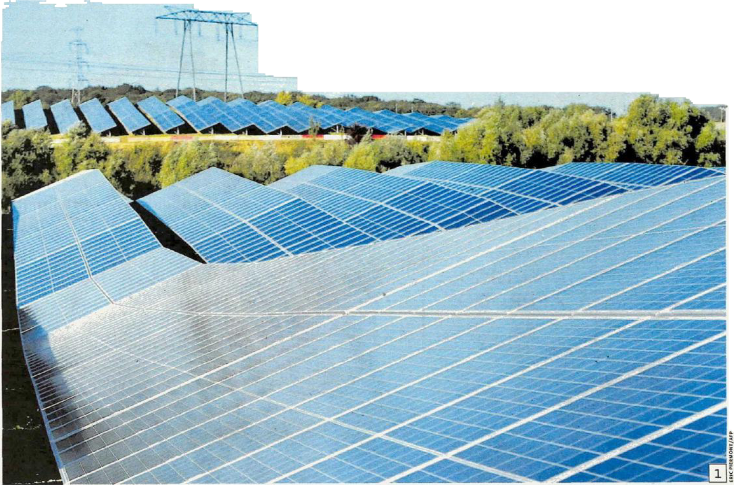
Ritaglio Stampa ad uso esclusivo del destinatario. Non riproducibile