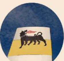
Domanda record. Eni ha collocato ieri due bond ibridi per 3 miliardi di euro

Energia Eni colloca bond ibridi per 3 miliardi Domanda boom